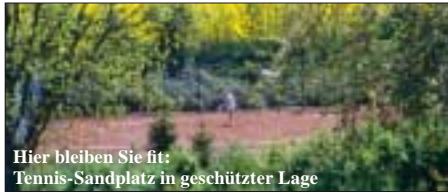
Hier bleiben Sie fit: Tennis-Sandplatz in geschützter Lage