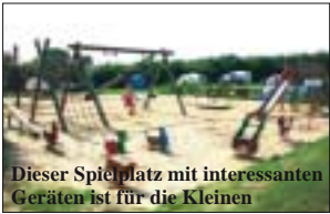
Dieser Spielplatz mit interessanten Geräten ist für die Kleinen

2 voneinander getrennt liegende Spiel- und Sportplätze für die Kleinen und für die Großen mit Basketball- und Beachvolleyballfeld, vierteiliger Skateanlage, Doppelseilbahn, TT-Platten und Fußballfeld. Tennis-sandplatz