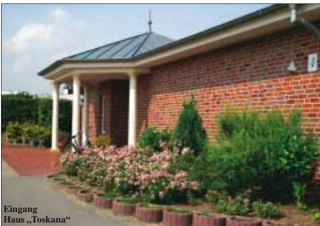
Eingang Haus „Toskana“